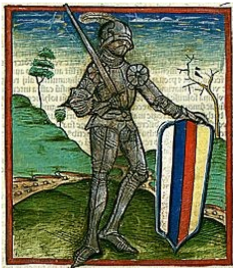
Hunyadi János (Túróczy-krónika)

Hunyadi János (Kolozsvár, 1407 körül – Zimony, 1456. augusztus 11.) 1446 és 1453 között Magyarország kormányzója. Az ország egyik leggazdagabb földesura, kiemelkedő hadvezér, több déli vármegye vezetője, erdélyi vajda. Az Oszmán Birodalommal szemben küzdelmei, elsősorban a nándorfehérvári diadal révén már kortársaitól kivívta magának törökverő melléknevet, annak ellenére, hogy az általa vezetett másik két jelentős csata, a várnai és a rigómezei súlyos vereséggel végződött.