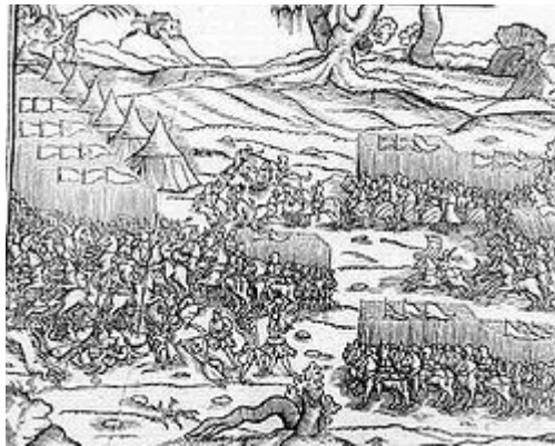
A várnai csata (Martin Bielski - Lengyel Krónika)